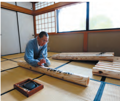
僧侶による壇木の浄書