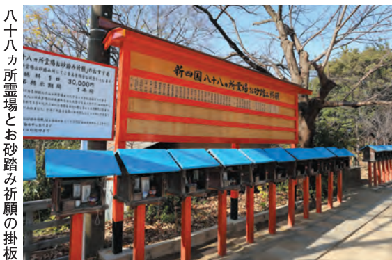
八十八カ所霊場とお砂踏み祈願の掛板