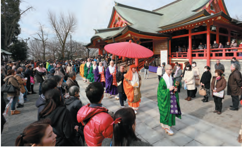
新年特別大護摩供のお練り行列

新年を迎え当山では、初詣で行事を執り行なっております。 ご信徒の皆さまが輝かしい年の始まりとともに不動さまのご加護を授かり、より良き年となられますようお祈り申しあげます。