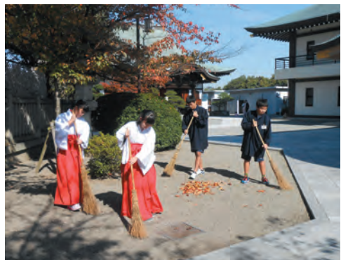
お参りされるご信徒のために大事な清掃

枚方市立東香里中学校の生徒男女各2名が、11月1日から2日間、当山にて職場体験学習を行ないました。