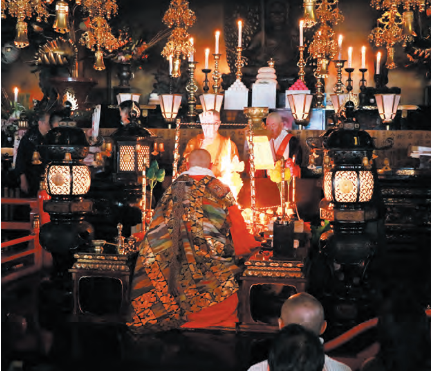
諸願成就を祈念する新年特別大護摩供