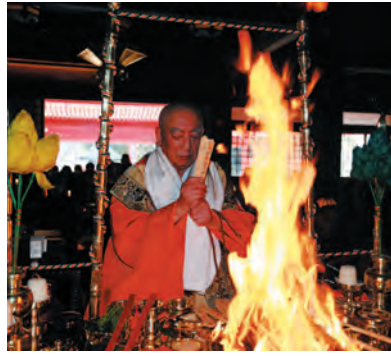
厄除け祈願のお護摩修業

5,000円 10,000円 20,000円 30,000円 50,000円以上