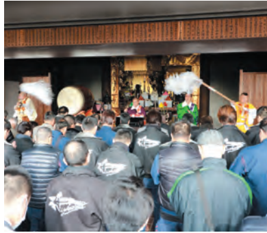
お車祈禱殿での新年のご祈禱

への意識も一新し、お不動さまのあらたかなるご加護をいただき、無事故で息災にてお過ごしになられますよう、お車ご祈禱をおすすめ申し上げます。