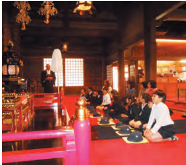
僧侶の説明を熱心に聞く児童たち