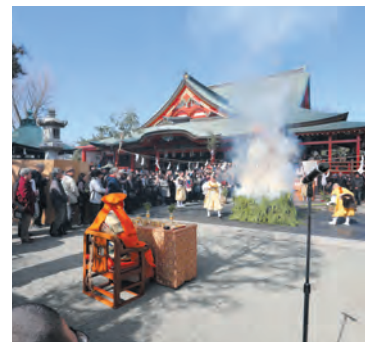
初不動柴灯大護摩供

本年最初のお不動さまのご縁日「初不動」は、一年のご縁日で最も深い功德を授かるとされます。