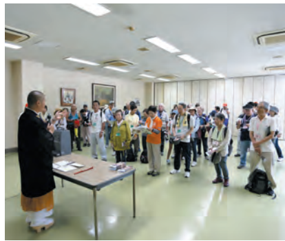
僧侶の話に耳を傾ける参加者の皆さま