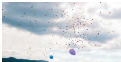
空高く舞い上がる500個の風船

園創立67周年お祝い 10月12日 子ども達にとって創立記念日は、自分達の誕生日と同じようにみんなでお祝いするものと、10月14日より一足早く保護者も大勢参加され実施。 式典や本園の歴史をふりかえる創立当初のスライドを見て、屋上からお祝いの500個の風船とばしに大歓声でした。