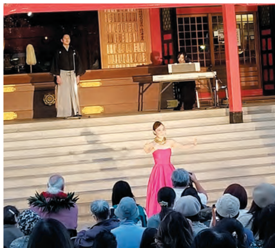
フラダンスと声楽の共演