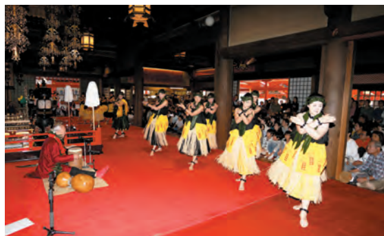
本堂内にてフラダンスの奉納