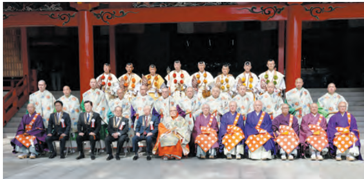
本堂前での記念撮影