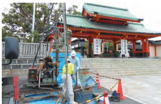
3カ所の地点で調査を実施いたしました

謹んで台風・地震災害のお見舞いを申しあげます 台風21号および24号や平成30年北海道胆振東部地震により甚大な被害が発生しました。 亡くなられた方々に謹んで哀悼の意を表します。 被災地の一日も早い復興をお祈り申しあげます。 成田山大阪別院明王院