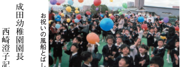
お祝いの風船とばし