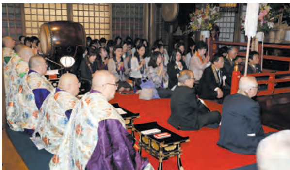
祝禱大法会にて一心に手を合わすご信徒