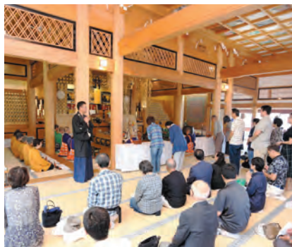
香を手向けのご信徒

9月23日、寝屋川市教育委員会主催の市民ウォーキングが行なわれました。 今回は、参加希望者から成田山をより詳しく知りたいとの要望があり、当山を訪れるコースが設定されました。 約200名の参加者へ当山の歴史や境内伽藍について説明させていただきました。