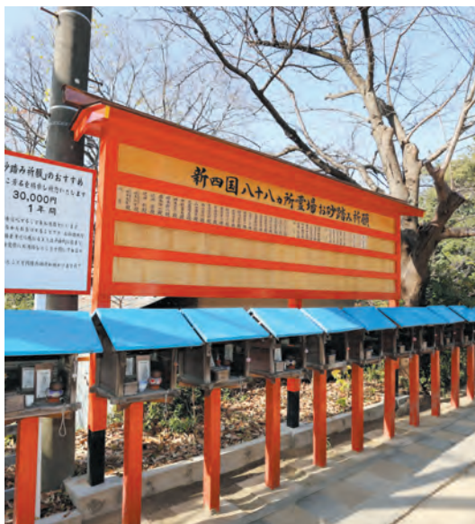
お砂踏み祈願ご芳名を掛板にて掲揚