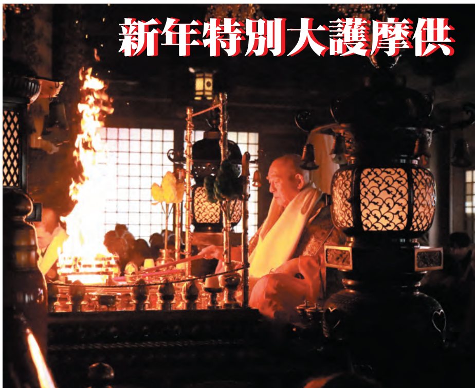
新年特別大護摩供

新しい年を迎えられ、ご信徒の皆さまにとって本年がより良き年になりますよう、新年特別大護摩供を元日(火)から1月31日(木)まで厳修いたします。 お不動さまのご加護を授かりご信徒それぞれの願いが成就されますよう、新年のはじめにお不動さまのご分身ご分