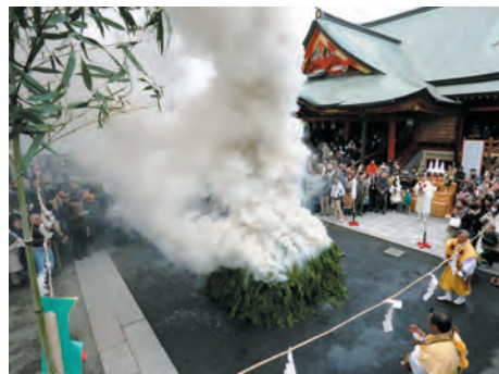
本堂前道場での柴灯大護摩供

ご志納者には、柴灯大護摩供ご志納特別札を授与いたします。 壇木には、お不動さまを表す梵字、ご信徒のお願いごと・お名前を浄書し、諸願成就を祈念いたします。