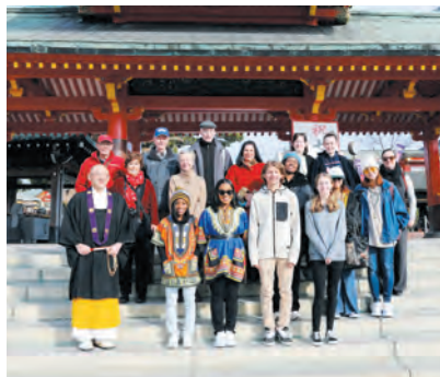
山門前での記念撮影