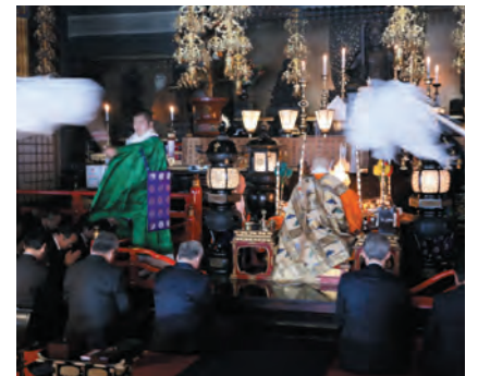
梵天祓いを受ける京阪グループの皆さま

都市であるアメリカ合衆国ニューポートニューズ市から市民訪問団18名が来山されました。