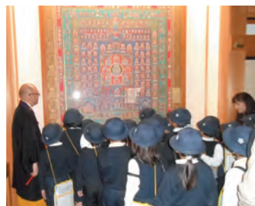
曼荼羅を見学する児童たち

11月14日、寝屋川市立第五小学校2年生24名が、校区内の施設やお店を見学しながら質問学習する「わたしたちの校区、町たんけん」学習を行ないました。