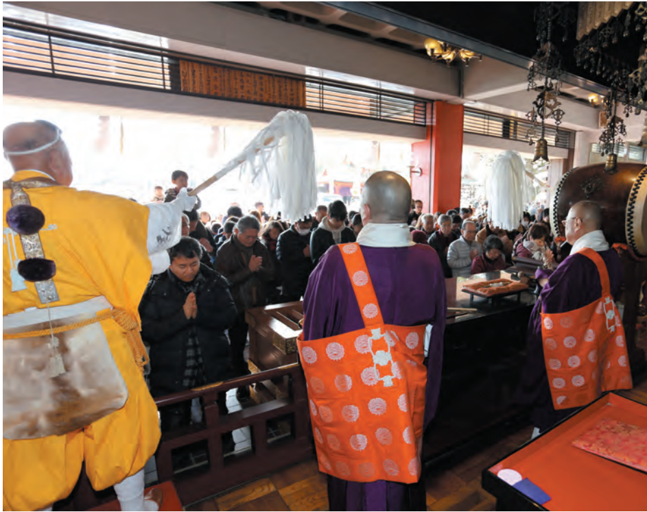
お車祈禱殿での新年交通安全祈願