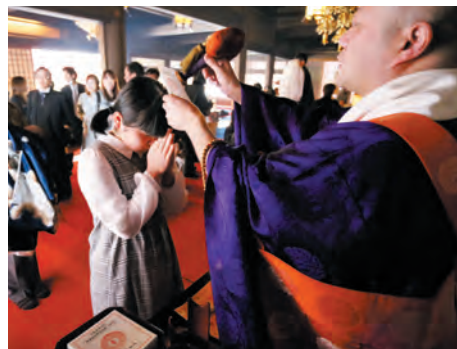
不動ご印紋のお加持

十三まいは、お子さまの成長を祝い、これまでの成長への感謝とともに、これからの智慧を授かるように祈願するお参りです。一般には、3月中旬から5月中旬に行なわれます。