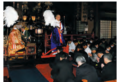
梵天祓いを受ける駅伝特練員のみなさま

2月14日、寝屋川警察署駅伝競走特練員の皆さまが来山されました。市民に安心を与え安全を守るべく日々鍛錬に励んだ成果を示すため、第52回大阪府警察駅伝競走大会での必勝を願って参拝されました。