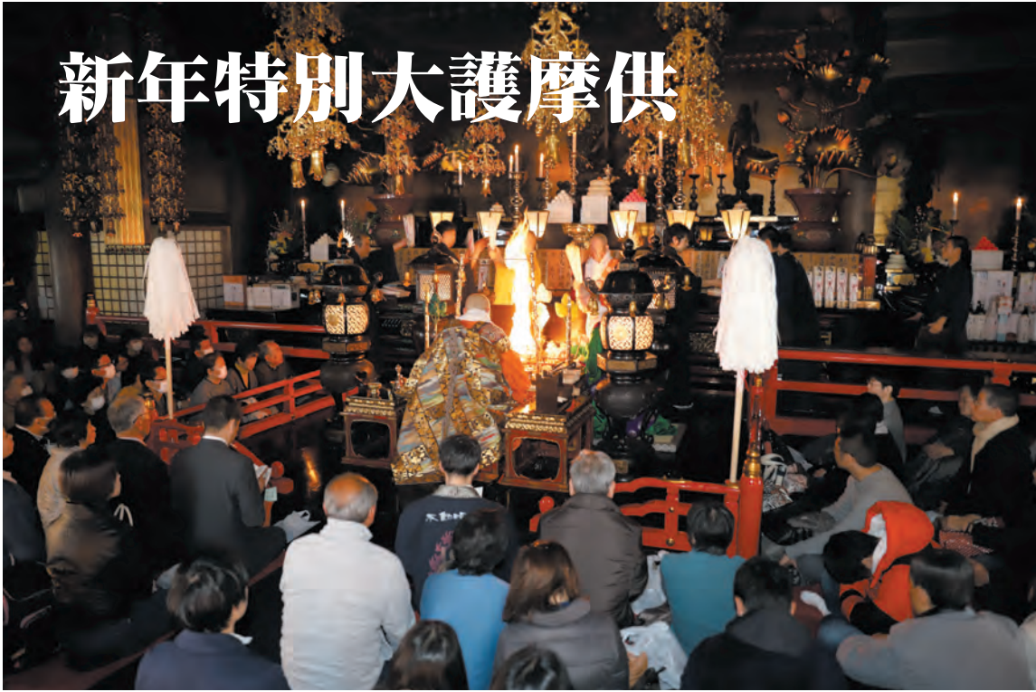
新年を迎えご信徒皆さまの開運厄除繁栄隆昌を祈念した新年特別大護摩供

新しい年を迎え、多くのご 信徒がお参りされました。 新年のご祈禱をお受けにな り、お不動さまのご加護をい ただかれました。