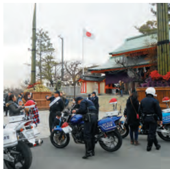
警察車両が展示されての広報啓発活動