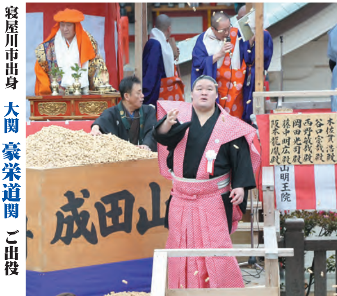
寝屋川市出身 大関 豪栄道関 ご出演