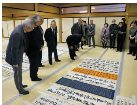
書家の先生方による審査

2月12日、第35回成田山全国競書大会の近畿地区審査会が当山で行なわれました。厳正なる審査の結果、近畿2府4県の小、中、高校生が応募した13,522点の作品から41点が、3月10日に開催される中央審査会へと進みました。