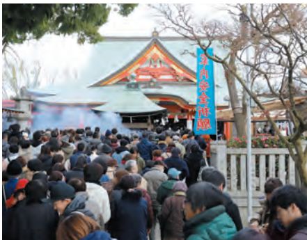
お不動さまへのお参りに本堂へ向かうご信徒