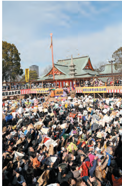
盛大に執り行なわれた特設舞台での豆まき

2月3日、伝統の盛儀である節分祭を執り行ないました。各界から著名人を始め多数の方々々が年男にご出演され、盛大に福豆が撒かれました。境内を埋め尽くすほどのご信徒が来山され、福をいただきました。