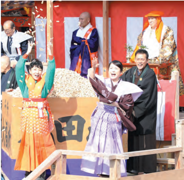
NHK連続テレビ小説「まんぷく」に出演 安藤サクラさん 松坂慶子さん ご出演