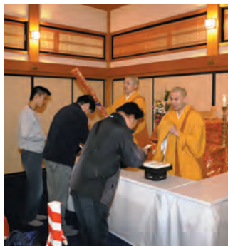
天国宝剣のお加持