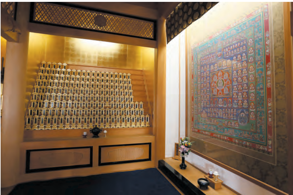
大師堂位牌壇と曼荼羅