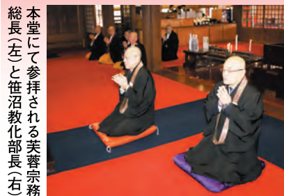
本堂にて参拝される芙蓉宗務 総長(左)と笹沼教化部長(右)