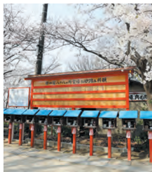
ご芳名を掛板にて掲揚