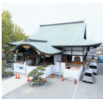
改修工事中の大師堂

工事完了は、6末日の予定です。ご信徒の皆さまにはご不便をおかけいたしますこととお詫び申し上げます。