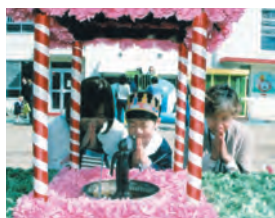
手を合わせてお祝いする親子

子ども達は、かわい冠をかぶり、健やかな成長を願うお加持、灌佛、甘茶をいただき、楽しいにぎやかなひと時を過ごしました。