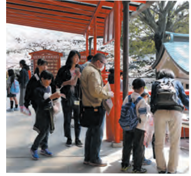
ラリーポイントでスタンプを押す参加者

4月6日、第28回「バス！のつてスタンプラリー桜めぐり」が開催され、スタンプポイントとして当山が協力いたしました。