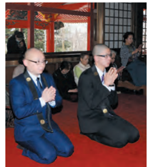
山内助監督(左)と学院生

3月11日、真言宗智山派の僧侶を育成する学校として認可されている成田山勸学院の学院生が、研修参拝のため来山寄宿いたしました。