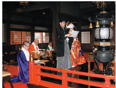
誓詞を読みあげる新郎新婦