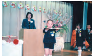
卒園証書を手にする卒園児

胸にお祝いのバラの花をつけた晴れやかな97名の子ども達。名前を呼ばれると大きな声で返事をし、卒園証書を手にした姿は とても立派でした。