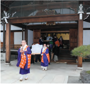
ご本尊さまの出堂