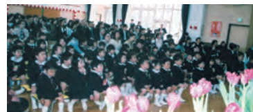
楽しい園生活のスタート