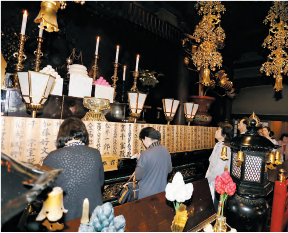
普段よりも近くでお不動さまを拝されるご信徒