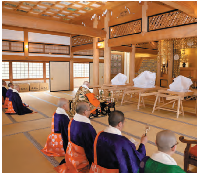
大師堂での遷座法要