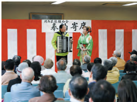
大勢のご信徒が来場された奉納寄席