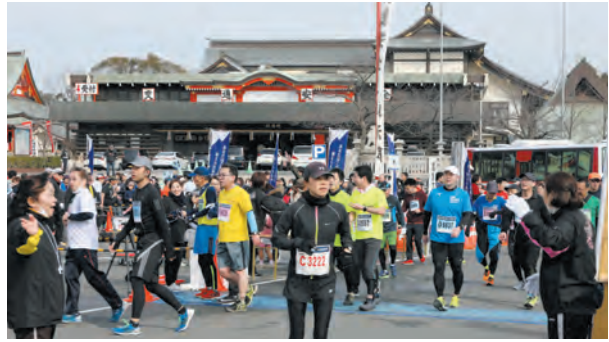
当山で折り返すランナー