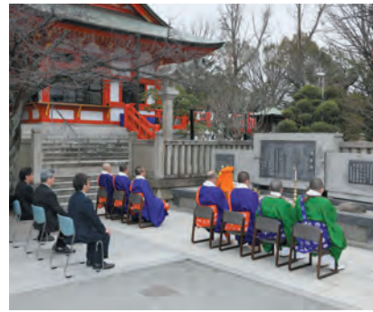
顕彰碑前での法要