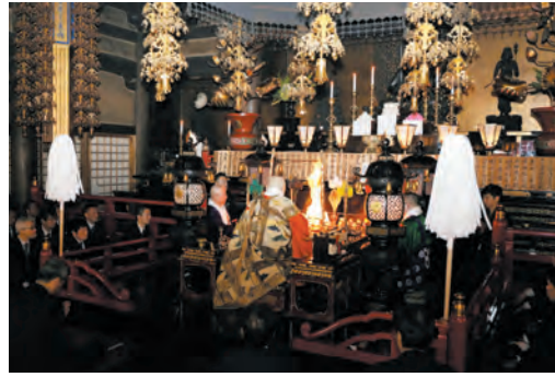
春の行楽シーズンでの安全を願う特別大護摩供

もと特別大護摩供を厳修し、春季輸送安全を祈願いたしました。大護摩供終了後には、当山開創に尽力された京阪電鉄功労者の顕彰碑前にて法要を厳修いたしました。