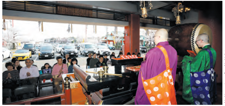
お車祈禱殿での祈禱

当山では、5月15日(水)まで春の交通安全祈願大祭を執り行なっております。 ぜひこの機会にお車ご祈禱をお申し込みいただき、ご祈禱札をお受けになられ、安全意识の向上を図るとともに不動さまへ事故や災難が無くお暮しいただけますようお祈りください。 期間中ご祈禱をお受けいただいた方には、護摩木にお名前を書いていただきます。