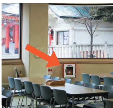
信徒休憩所やすらぎにAEDを設置

医療従事者でない一般の方でも使用することができますので、万が一の場合は、ためらわずご使用ください。