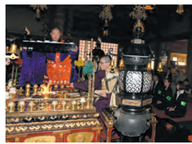
詐欺被害防止を祈願しお守りをお加持

5月13日、春の地域安全運動の一環として、寝屋川警察署員が護摩に参拝され、特に高齢者に多い特殊詐欺被害の防止を願われました。また、寝屋川警察署の依頼により当山にて謹製した詐欺除けお守りをお加持申しあげました。