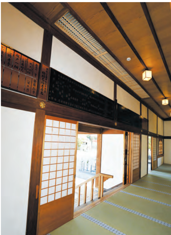
正面入口に設置したエアカーターン