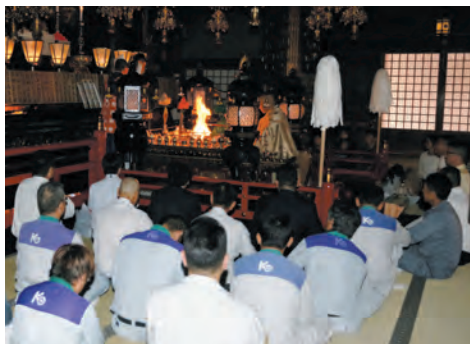
職場での安全を祈願