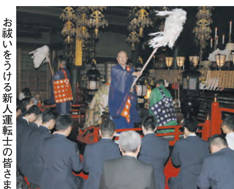
お祝いをうける新人運転士の皆さま

5月13日、春の地域安全運動の一環として、寝屋川警察署員が護摩に参拝され、特に高齢者に多い特殊詐欺被害の防止を願われました。また、寝屋川警察署の依頼により当山にて謹製した詐欺除けお守りをお加持申しあげました。