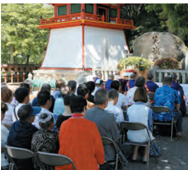
笑魂塚前での慰霊法要

今日まで演芸一筋に励んでこられた先輩芸人の功績を偲んでご冥福をお祈りし、関西演芸界の更なる発展を願われました。