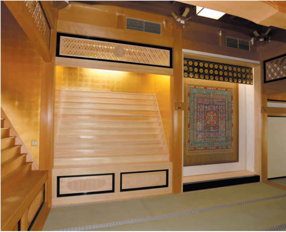
増設した位牌壇と移設した曼荼羅 (上部の格子はエアコンの吹出口)