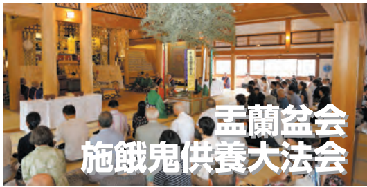
孟蘭盆会 施餓鬼供養大法会

当山夏の風物詩、笑魂まつりを8月15日(木)に開催いたします。 午後5時30分から笑魂塚前にて厳修いたします柴灯大護摩供では、関西芸能親和会が願主となられ、先輩芸人の霊を慰め芸道発展を祈ります。 引き続き、お護摩の残り火