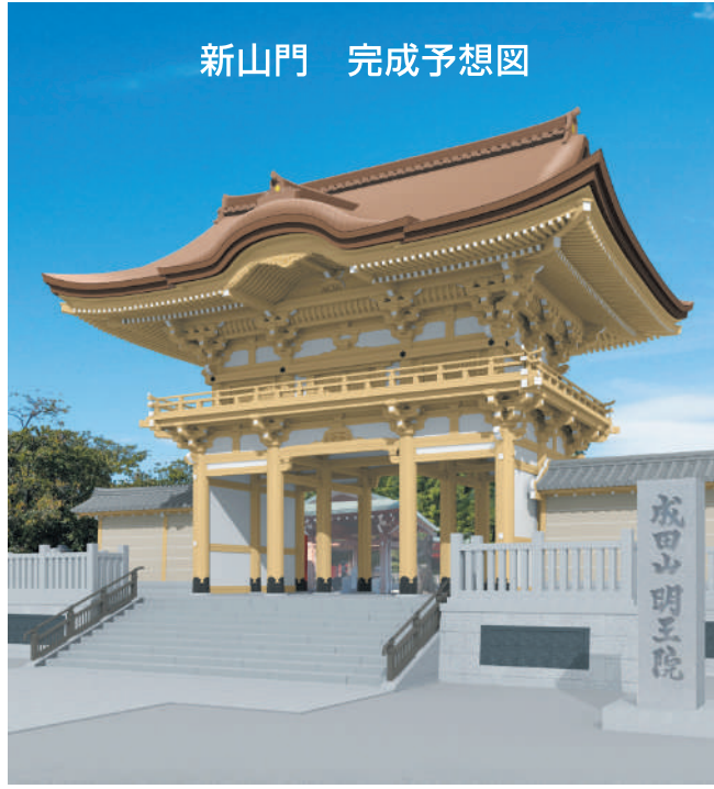
工期 令和6年6月完成予定 令和6年10月落慶

ご信徒の皆さまには、山門 建立の浄業達成にご支援賜り たく、記念事業費のご志納を お願いいたしております。