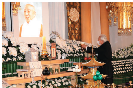
献茶される千玄室大宗匠