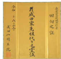
回向之証を授与いたします