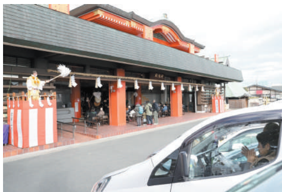
人車一体のご祈禱