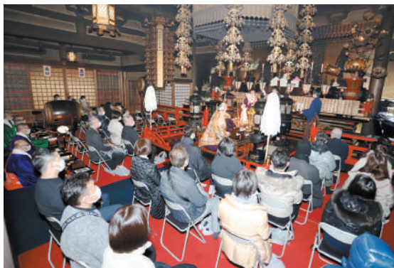
新年のお護摩ご祈禱