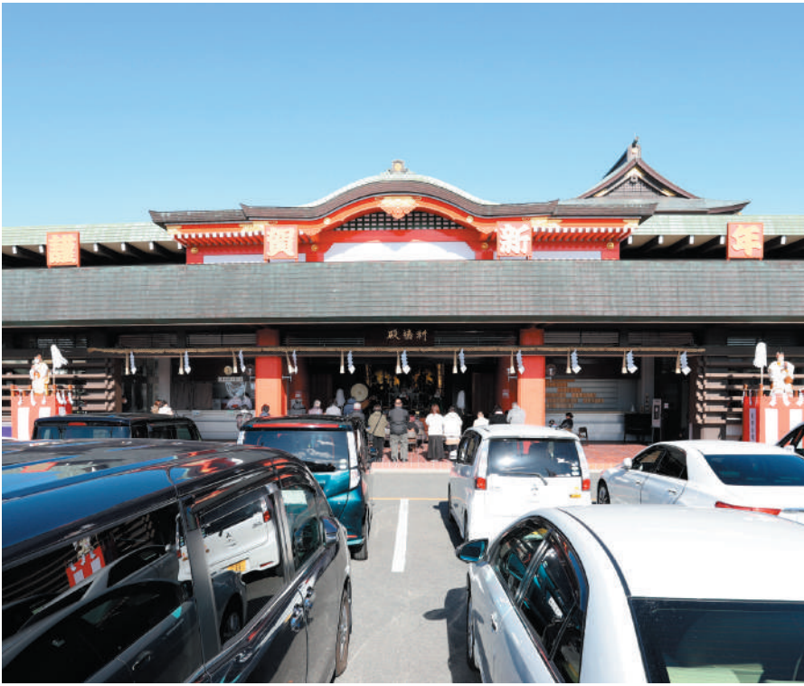
お車祈禱殿にて新年のお車ご祈禱を厳修