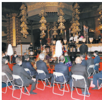
年末年始の安全を祈願