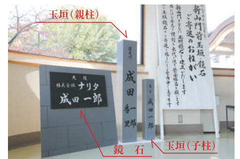
玉垣・鏡石の原寸大模型を展示【信徒休憩所やすらぎ】