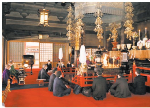
安全祈願の特別大護摩供

コロナ禍の影響により従来どおりの業務遂行が厳しい状況のなか、適切に対応される同社の皆さまには、お不動さまのご加護のもと、より一層の安心と安全が保たれますようお祈り申しあげます。