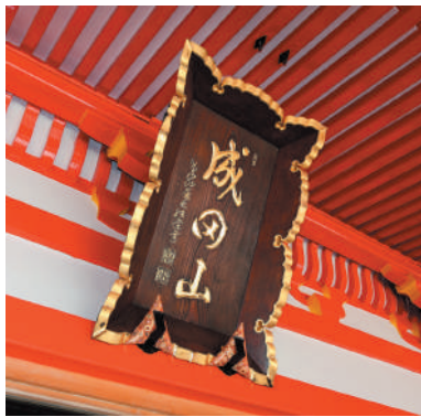
本堂に掲揚されている山号額

寺院の名称に冠する称号(当山では「成田山」のこと)を山号といい、この山号を額(の)形で装飾したものが山号額といわれます。