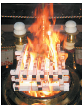
護摩木をお焚きしてご祈念