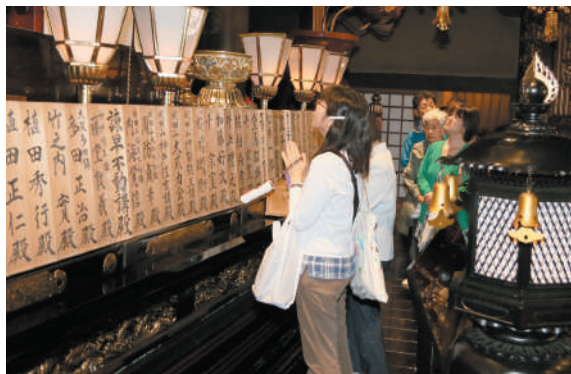
お不動さまを間近で拝するご信徒