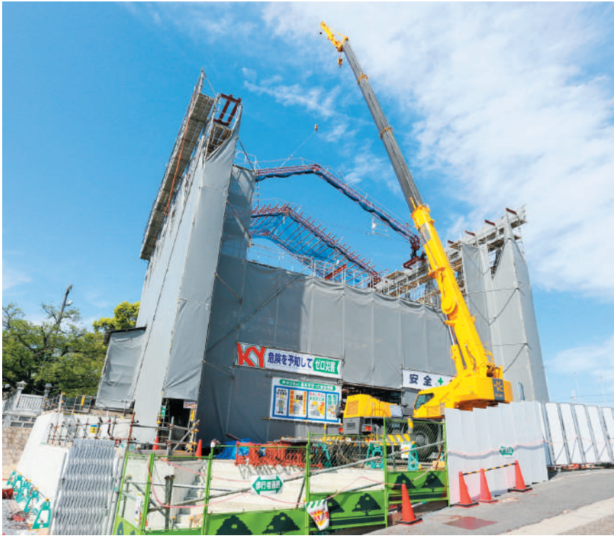
素屋根の骨組の施工風景