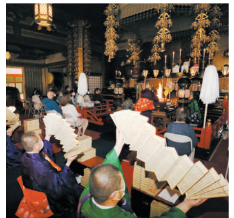
※現在椅子は設置していません

掘削地盤改良などの造成工事、玉垣の土台部分を兼ねる擁壁の建設、新山門および築地塀の基礎コンクリートの打設、正面階段の躯体工事、山門柱礎石の据付が行なわれ、令和3年末には新山門建立地および周辺の整備の基本構造が完成いたしました。