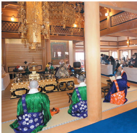
懇ろにご供養された春の彼岸会法要