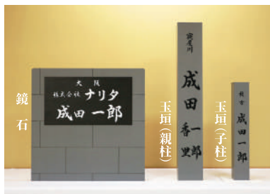
玉垣・鏡石の原寸大模型を展示【信徒休憩所やすらぎ】