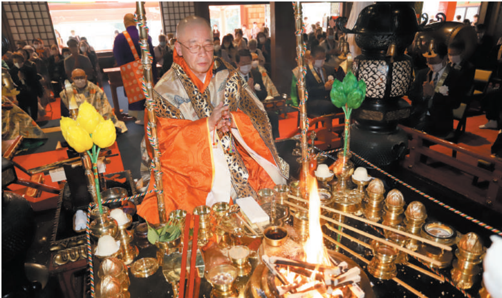
岸田照泰貫首猊下ご巡錫