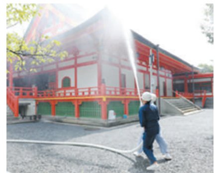
本堂大屋根への放水訓練