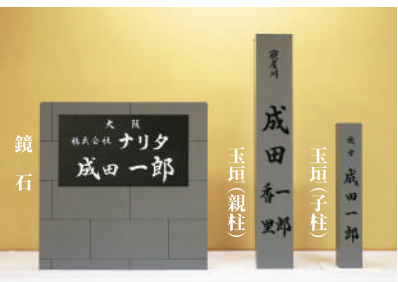
玉垣・鏡石の原寸大模型を展示【信徒休憩所 やすらぎ】