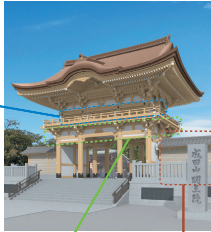
新山門完成予想図

開創90周年記念事業新山門建立は、7月に下層部の組み立てが完了し、8月から上層部の木工事に取 り掛かっております。