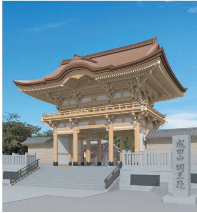
工期 令和6年6月完成予定 令和6年10月落慶