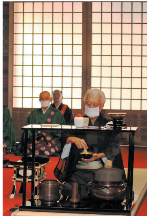
千玄室大宗匠のお点前 (開創88周年記念献茶式)