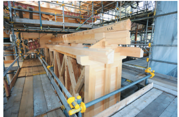
築地塀(ついでい)の骨組

斗組(ますぐみ)とは、柱上にある斗と肘木で構成され、軒など上部構造を支える木組みのこと