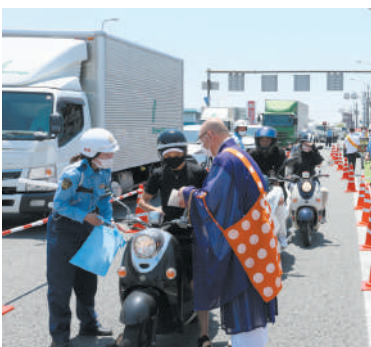
寝屋川警察署の活動