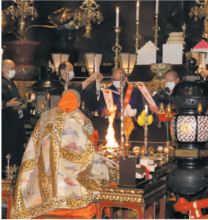
大祭大護摩供でのお護摩札のお加持

開創記念大祭では、11時の記念祝禱大法会での大護摩供のほか、9時・13時・15時にも大祭大護摩供を厳修いたします。 大祭大護摩供厳修に際して、ご信徒皆さまにはお護摩ご祈禱のお申し込みをおすすめいたします。