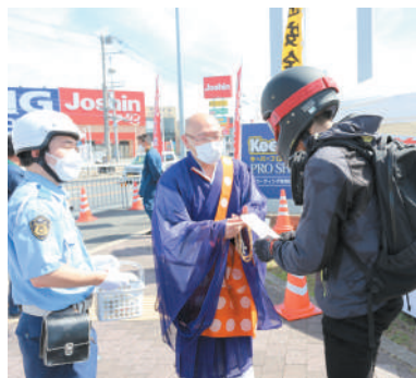
枚方警察署の活動