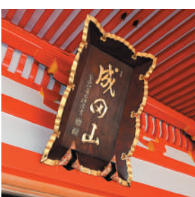
当山本堂の山号額