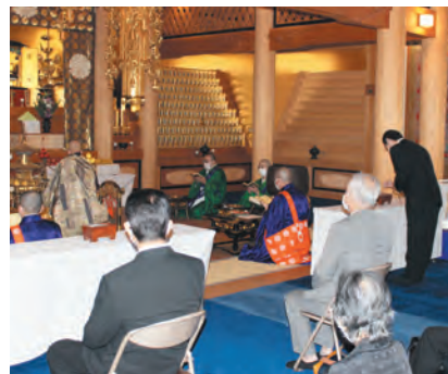
大師堂での慰霊法要

12月14日、京阪ホールディングス株式会社、京阪電気鉄道株式会社をはじめとする京阪グループ各社の皆さまが来山され、本堂にて特別大護摩供が厳修されました。 お不動さまへの1年間の御礼参りとともに、年末年始のグループ各社の乗客ならびに社員皆さまの安全を願われました。