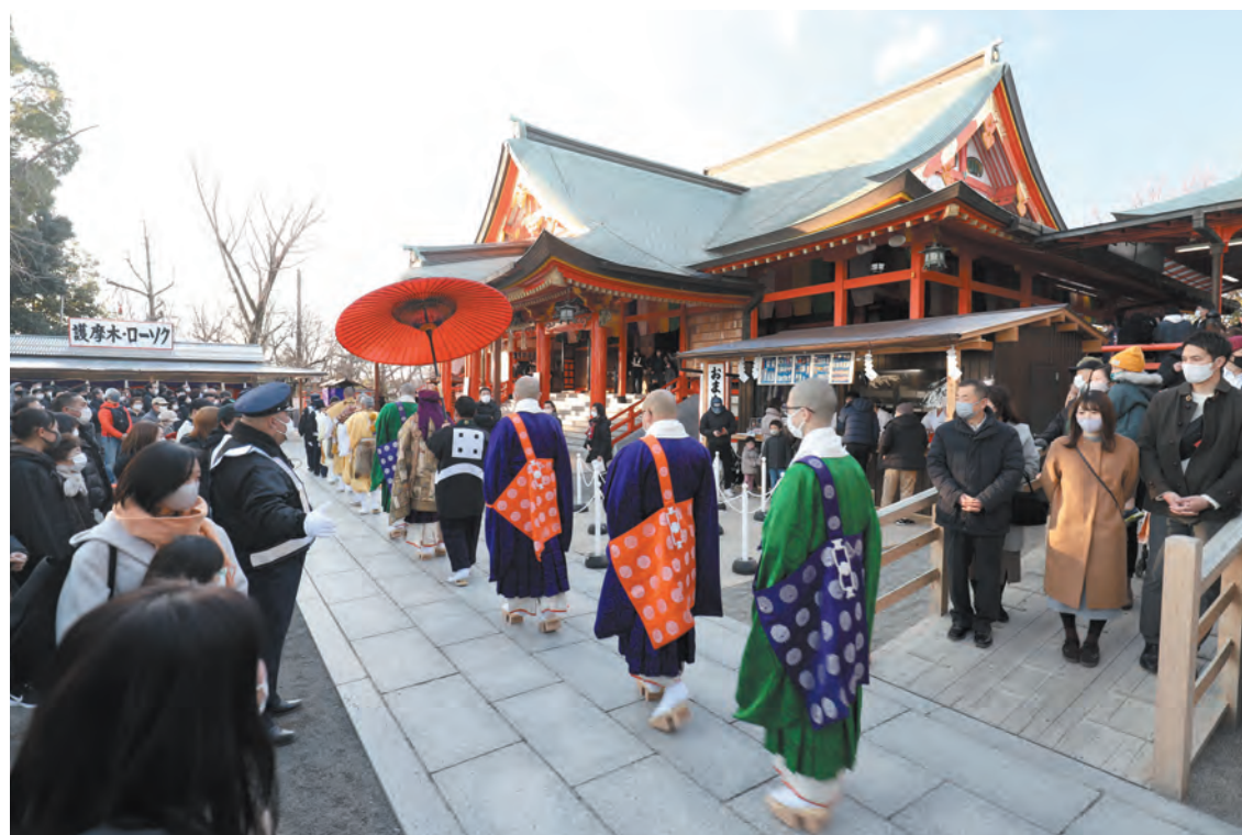
本堂へ向かう新年特別大護摩供の行列

発行所 成田山大阪別院 法 教 部 寝屋川市成田西町10-1 電 話 072-833-8881 F A X 072-833-1334 郵便番号 572-8528