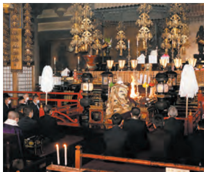
輸送安全祈願の特別大護摩供を奉修

12月14日、京阪ホールディングス株式会社、京阪電気鉄道株式会社をはじめとする京阪グループ各社の皆さまが来山され、本堂にて特別大護摩供が厳修されました。 お不動さまへの1年間の御礼参りとともに、年末年始のグループ各社の乗客ならびに社員皆さまの安全を願われました。