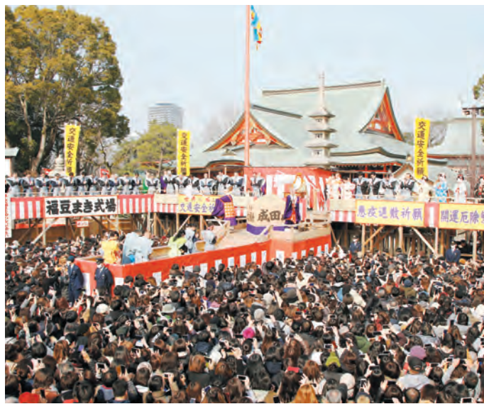
節分祭での特設舞台