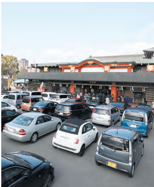
新年の交通安全祈禱を行なうお車祈禱殿

当山では元日(日)から1月31日(火)まで、初詣で行事として新年特別大護摩供ならびに新年お車安全祈願大祭を奉修し、新年を迎えたご信徒の諸願成就をお祈り申し上げております。