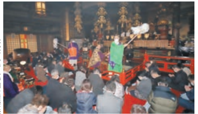
本堂での新年特別大護摩供