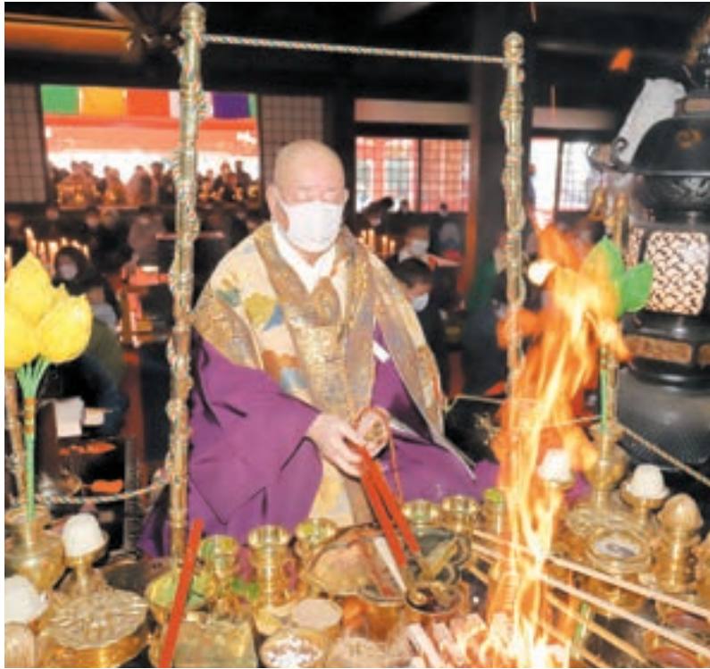
新年特別大護摩供を奉修される金剛照祐主監