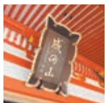
当山本堂の山号額