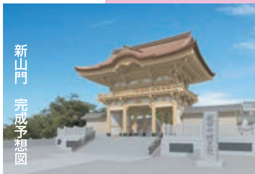
新山門 完成予想図