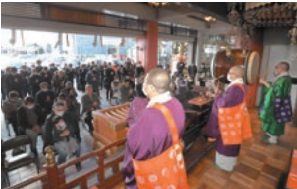
お車祈禱殿での新年お車安全祈願大祭