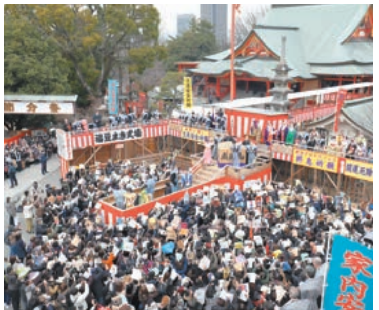
特設舞台での豆まき式

節分祭では、追儺式特別大護摩供を厳修し、3年ぶりに特設舞台での豆まき式を執り行ないました。多くのご信徒が福豆を受けられました。