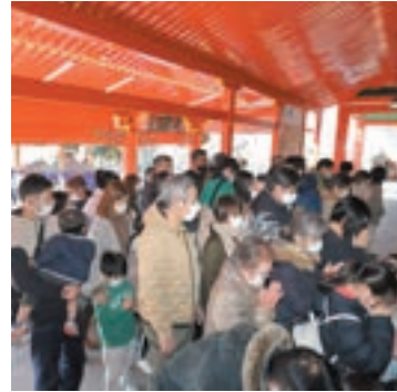
本堂にてお参りされるご信徒

初詣で行事として新年特別大護摩供ならびに新年お車安全祈願大祭を執り行ない、ご信徒皆さまの諸願成就をお不動さまにお祈りいたしました。