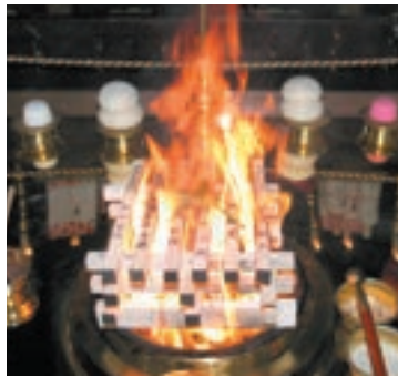
護摩木をお焚きしてご祈念

交通安全に対する意識が高まるこの機会に、お車ご祈祷をお受けになられ、お不動さまのご加護をいただかれることをおすすめ申し上げます。