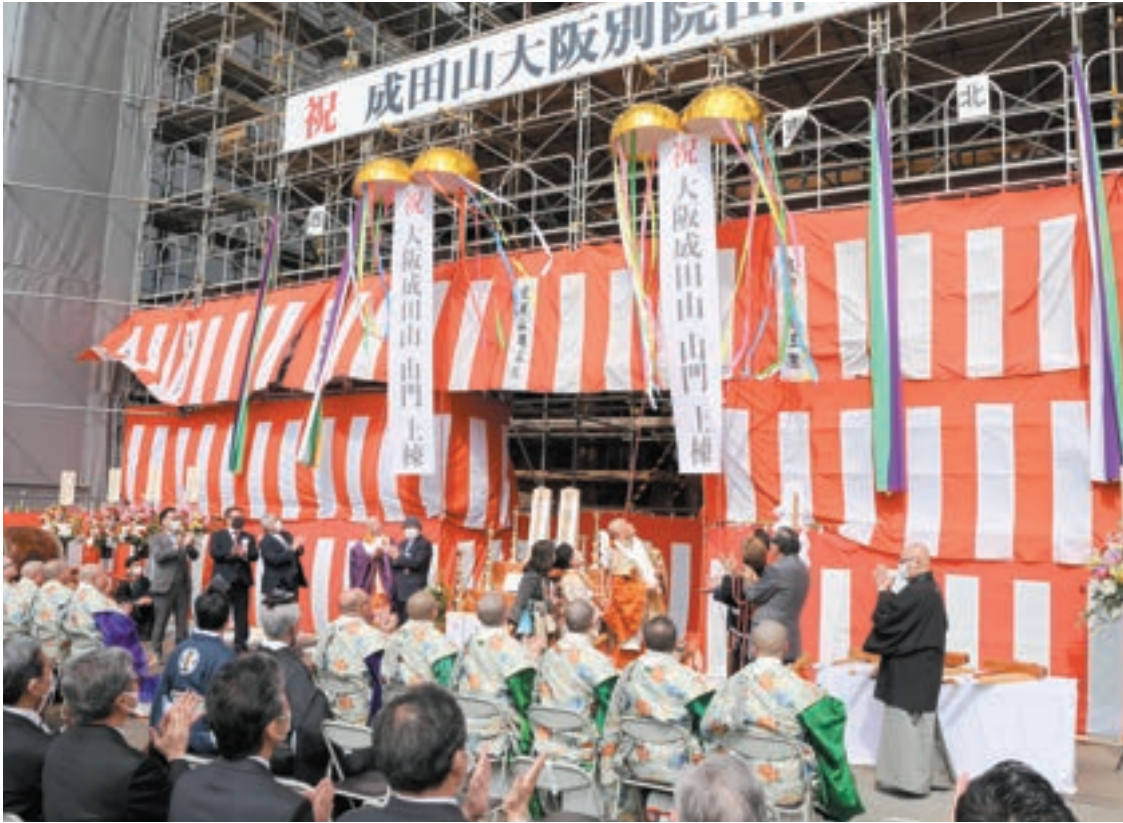
新山門建立上棟式でのくす玉開き