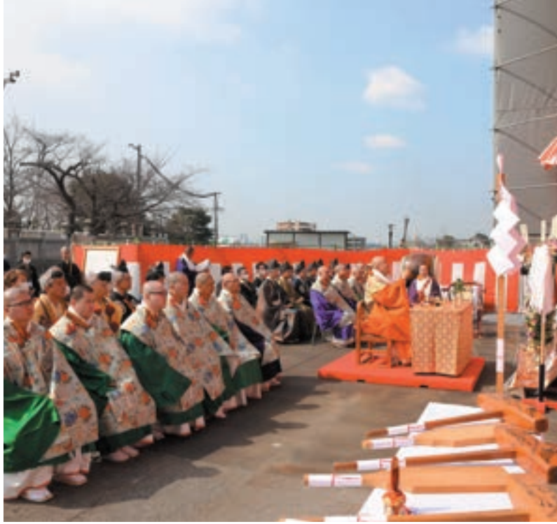
大導師ならびに職衆・修験・工匠衆・総代・篤信・施工関係者が参列

曳綱にて棟木があげられ、工匠衆によって打ち固められました。 四方固めの儀、くす玉開き、記念式典を執り行ない、上棟を祝し工事安全と無魔完成を祈りました。