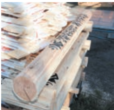
壇木の骨組みとなる壇木

当山では、柴灯大護摩供を年4回(初不動・笑魂まつり・開創記念大祭・納め不動)厳修いたしております。 ご信徒の皆さまには、柴灯大護摩供厳修に際し、壇木をおすすめいたしております。 お申し込みいただき、諸願成就をお祈りください。