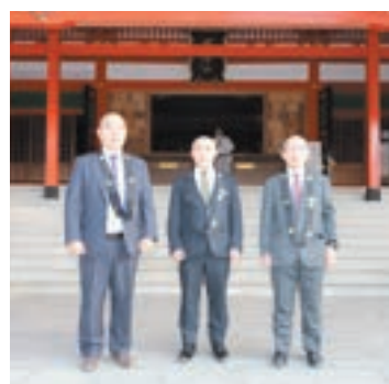
学院生と山瀬勸学院監督(左)

3月11日、真言宗智山派の僧侶教育機関である成田山勸学院の学院生が来山寄宿されました。