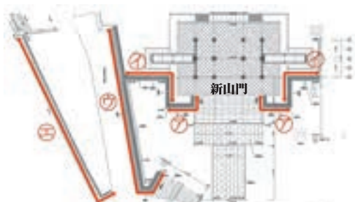
新山門平面図と玉垣・鏡石の建立位置