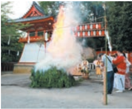
笑魂塚前での柴灯大護摩供

が5月10日に逝去されました。88歳でした。 佐伯氏には、平成8年から令和元年まで総代として当山の護持発展にご尽力ご信託を賜りました。 ご厚恩に対し厚く御礼申しあげますとともに、衷心よりご冥福をお祈りいたします。