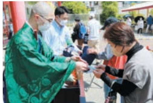
僧侶から詐欺除お守を授与

5月11日、当山では寝屋川警察署による特殊詐欺被害防止対策に協力し、寝屋川市内のショッピングセンターにて詐欺除お守の無料授与が行なわれました。