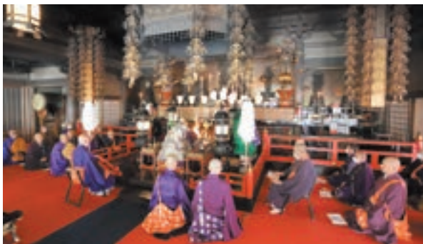
本堂にて厳修された春季法要特別大護摩供

参列され、お笑いの発展に尽くされた関西演芸家先輩諸氏のご冥福をお祈りし香を手向けられました。 会員の皆さまには、諸先輩の遺志を継ぎ芸道に励まれ、関西演芸界を盛り上げていただき、益々のご発展と更なるご活躍を願っております。