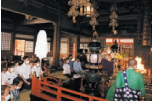
お護摩を受けられる新人運転士の皆さま(左側)