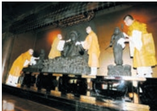
煤を丹念に取り扱います

当日は、7時30分の朝護摩供ののち、本堂でのお護摩は中止いたしますが、お護摩祈祷はお車祈祷殿にて厳修させていただきます。ご了承ください。