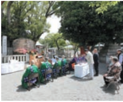
焼香される関西演芸協会の皆さま