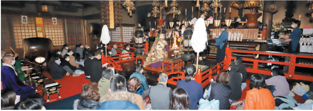
本堂での新年特別大護摩供