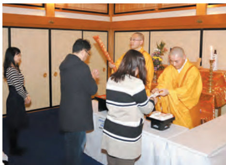
大師堂での天国宝剣のお加持

元日(月)〜5日(金) 天国宝剣特別お加持 成田山第一の霊宝である天 国宝剣にて無病息災のお加持 を執り行ないます。