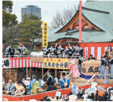
特設舞台での豆まき

立春の前日にあたる2月3日(土)に、厄を祓い福を招く節分祭を執り行ないます。本堂での追儺式特別大護摩供、千升大福枮を設置した特