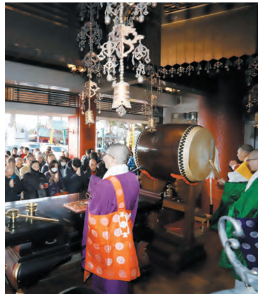
新年お車のご祈禱

1月8日(月) 11時30分 大般若経転読付 特別大護摩供 大般若経の広大無辺なる功 徳を得て、ご信徒の諸願成就 をお祈り申しあげます。