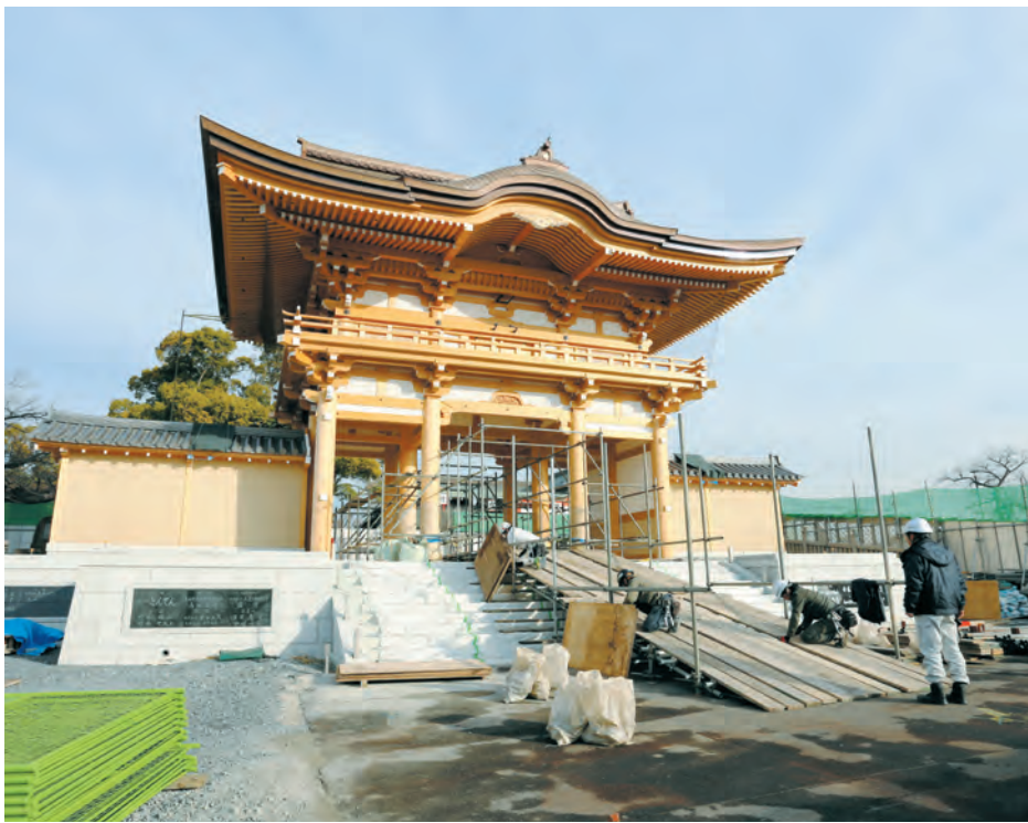
初詣で参拝者通路施工中の新山門