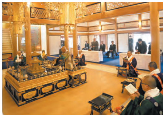
大師堂で営まれた慰霊法要

新型コロナウイルスが5類に移行さ れて半年あまり、利用客の回 復が見え始めている中、お不 動さまのご加護のもと年末年 始の安全な運行を願うとともに に益々ご繁栄されますことを お祈り申し上げます。