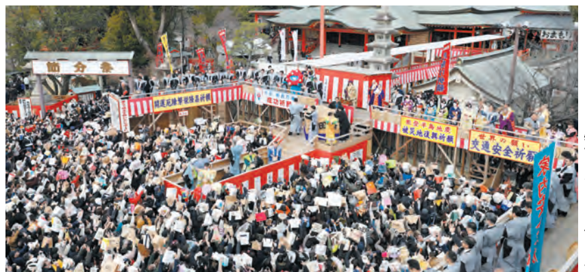
特設舞台での豆まき式