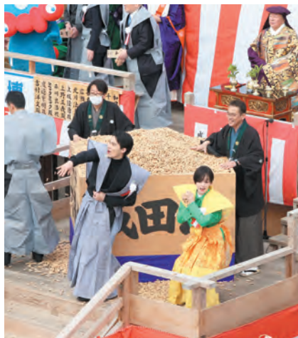
千升大福餅からの豆まき