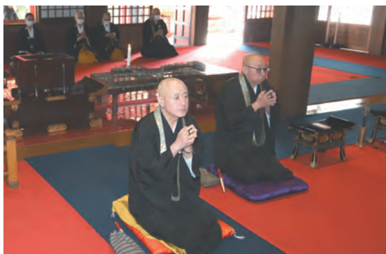
芙蓉宗務総長(左)と服部教化部長(右)