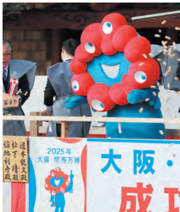
大阪・関西万博公式キャラクター ミヤクミヤクがご出演