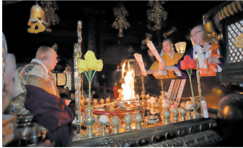
新年特別大護摩供を奉修する金剛照祐主監

新年を迎え当山では、新年特別大護摩供、新年お車安全祈願大祭の初詣で行事を執り行ない、ご信徒皆さまの開運厄除諸願成就をご本尊不動明王にお祈り申しあげました。 多くのご信徒が参拝され、お不動さまのご利益をいただかれました。