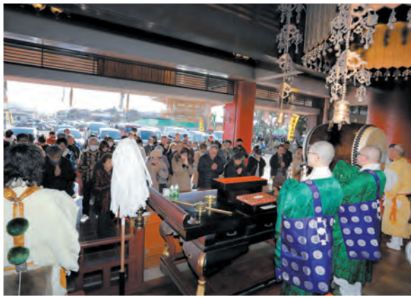
新年の無事故安全を祈願

新年を迎え当山では、新年特別大護摩供、新年お車安全祈願大祭の初詣で行事を執り行ない、ご信徒皆さまの開運厄除諸願成就をご本尊不動明王にお祈り申しあげました。 多くのご信徒が参拝され、お不動さまのご利益をいただかれました。