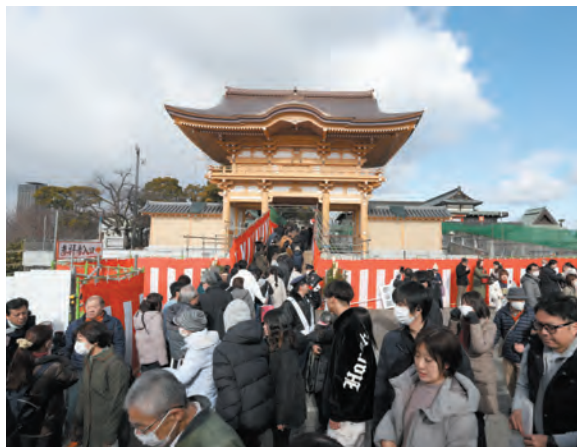
新山門の初詣で参拝者通路を渡るご信徒