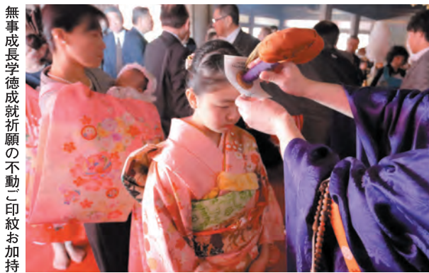
無事成長学徳成就祈願の不動ご印紋お加持

さまお一人おひとりに不動ご印紋のお加持をお授けし、無事成長学徳成就を祈願いたします。 新学年を迎えるにあたり、お参りされますようおすすめて申しあげます。