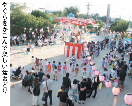
やぐらをかこんで楽しい盆おどり