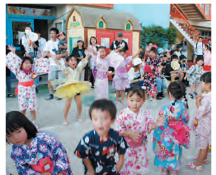
楽しくおどる子ども達

子ども達は自分で模様をつけたうちわを手に浴衣姿や甚平姿で、また保護者も一緒に日々元気で過ごさせてもらっていることに感謝し、にぎやかに楽しくくりひろげられました。