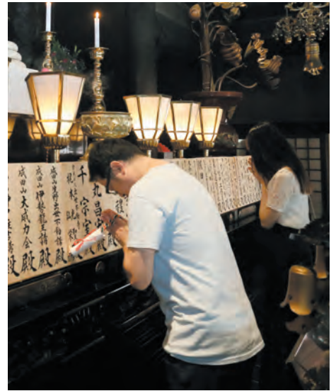
綱に触れお参りされるご信徒

お手綱参拝とは、お不動さまの左手に繋がれた五色の綱に触れることで、お不動さまとのご縁を深め、廣大無辺なる功德を授かるお参りでございます。