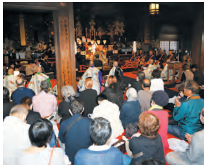
開創記念祝禱大法会