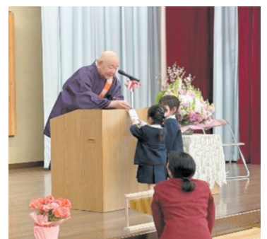
お祝いをもらう新入園児